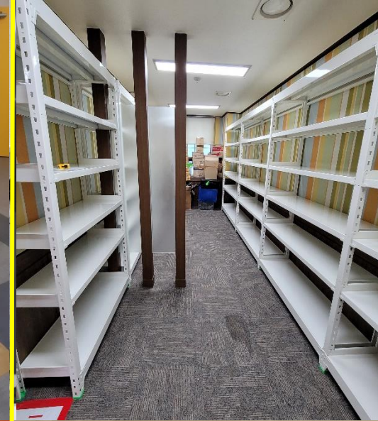
자재창고 중량랙 설치 [ 월성원자력 ]