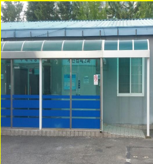
케노피 공사 [ 동울산세무서 ]