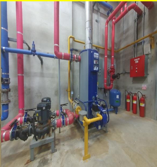
보일러 시공 [ 울산동구노인요양원 ]