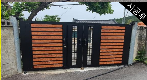
주택대문공사 [ 세이브더칠드런 ]