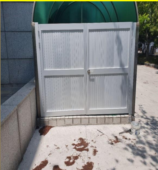
비상계단 도어맞춤제작 [ 울산세무서 ]