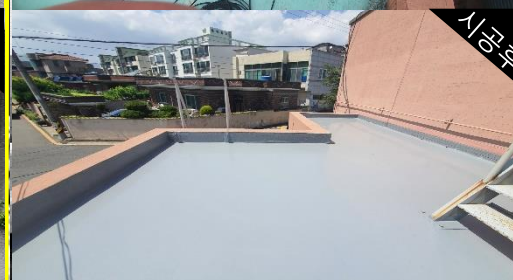
경로당 옥상방수 [ 울주군청 ]