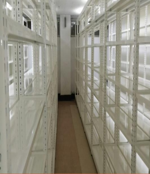
문서고 선반설치 [ 동울산세무서 ]