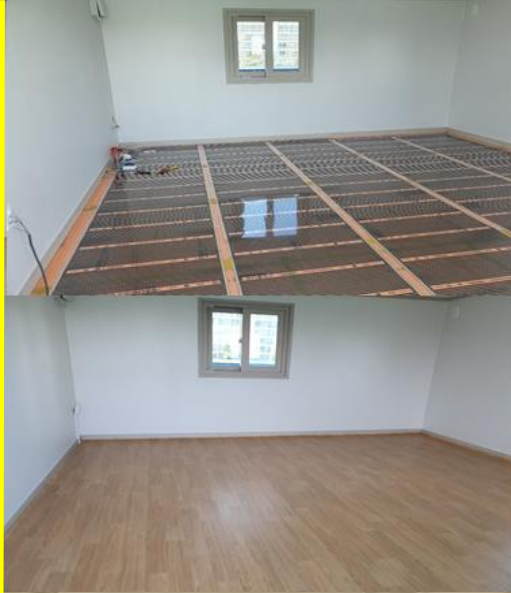
필름난방 시공 [ 울산세무서 ]