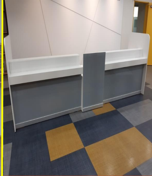
안내데스크 설치 [ 시설관리공단 ]