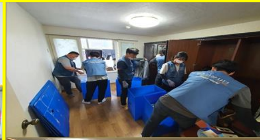
관공서.대기업 자원봉사 지원사업