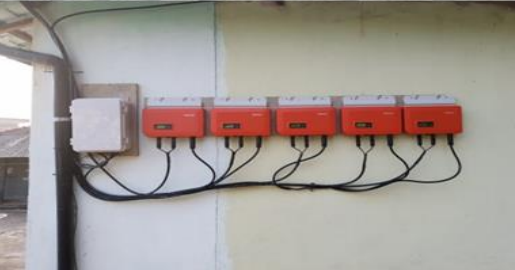
태양광 설치 [ HABITAT - 삼성물산 ]