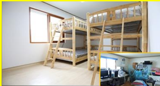
희망의 집 고치기 [ 예람청소년회복센터 ]